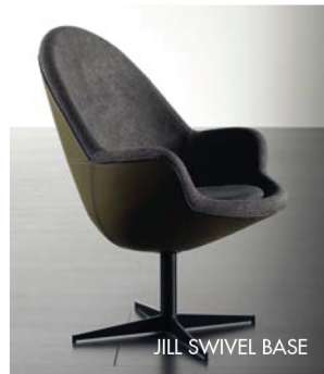
JILL SWIVEL BASE