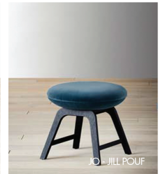
JO - JILL POUF

JO · poltroncina imbottita non sfoderabile · struttura in poliuretano rigido realizzato a stampo · imbottitura in poliuretano a stampo categoria FR · basamento: girevole in metallo verniciato nero opaco fisso in rovere tinto - vedi campionario