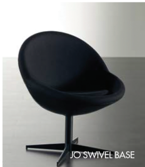
JO SWIVEL BASE