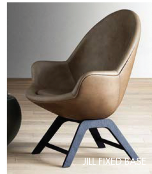
JILL FIXED BASE