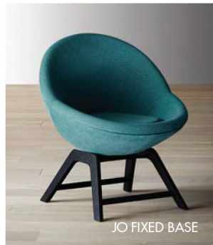
JO FIXED BASE